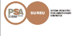
TAVOLA DRN_1.4 ADOTTATO APPROVATO

QUADRI P1011 54302 544053 544054 SCALA 1:10.000